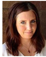
My Eklundh Projektassistent TEBAB